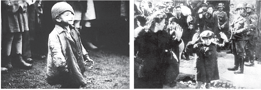
A gyermek alakja indexikus archív felvételeken. Jeles András: Senkiföldje (1993) / Alain Resnais: Sötétség és köd (1955); Ingmar Bergman: Persona (1966)

A Senkiföldje zárlatában az archív felvételeket lassítva, nagyítóüveg alatt látjuk. Ily módon, a nagyító által pásztázott archív képeken a történelmi nagy-elbeszélés személyes történetekké, a tömeg egyénekké, (gyermek)arcokká fordítódik vissza, bontódik le, vizsgálati anyaggá válik a történelem.