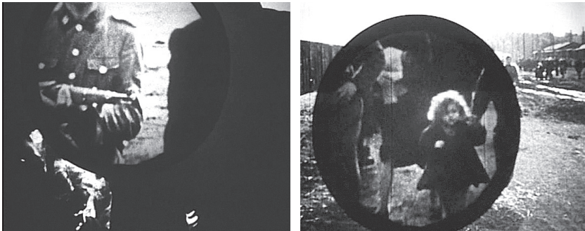
Archív felvételek nagyítóüveg alatt. Jeles András: Senkiföldje (1993)

A Senkiföldje zárlatában az archív felvételeket lassítva, nagyítóüveg alatt látjuk. Ily módon, a nagyító által pásztázott archív képeken a történelmi nagy-elbeszélés személyes történetekké, a tömeg egyénekké, (gyermek)arcokká fordítódik vissza, bontódik le, vizsgálati anyaggá válik a történelem.